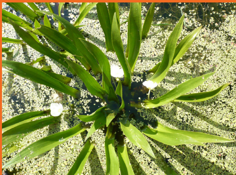
Krabbenscheer in bloei

Ook de witte bloemen, waarvan er steeds maar één tegelijk bloeit, zijn duidelijk zichtbaar. Deze plant komt in grote getale voor, ondanks dat elk jaar bij het schoonmaken van de waterpartijen maar een derde van deze planten mag blijven staan. Dit in verband met de doorstroming van het water, want de Krabbenscheer is in staat om een sloot dicht te laten groeien!