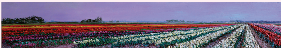
“Bollen verdwijnen Rechts”, Olieverf op doek, 30 x 180 cm

Maandagavond 5 november vanaf 19.45 uur bent u uitgenodigd voor deze inloop in De Twaalf Hoven, Meeden 1. De lezing start om 20:00 uur en is rond 22:00 is de lezing afgelopen.